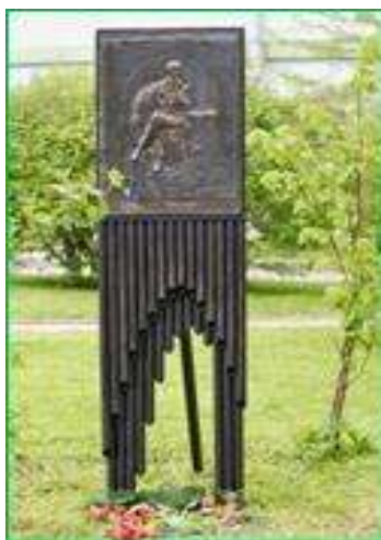
Памятник В. В. Набокову, играющему в шахматы во дворе филологического факультета СПбГУ – первый в России памятник писателю (автор – В. Аземша, 2007 г.)

ДУШЕНКО К. Цитаты из русской литературы : справ. : 5200 цитат от «Слова о полку...» до наших дней / К. Душенко. – Москва : Эксмо, 2005. – 704 с.