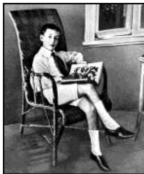
В.Набоков в детстве

МУРАШОВА Н. Сто дворянских усадеб Санкт-Петербургской губернии : ист. справ. / Н. Мурашова. – Санкт-Петербург : Выбор, Инф. центр, 2005. – С. 74 (Рождествено).