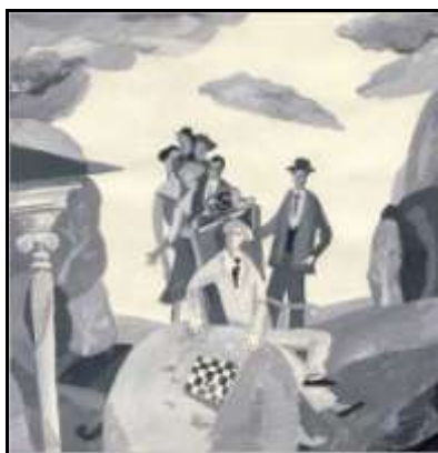
И. Сухов Иллюстрация к роману В. Набокова «Защита Лужина»

НАБОКОВ В.В. Камера обскура : роман, рассказы / В.В. Набоков ; предисл. П. Левин. — Москва : ОЛМА-ПРЕСС, Издательская фирма, 2000. — 350 с. — (Вавилонская библиотека).