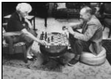
В. Набоков с женой Верой

НАБОКОВ В.В. : pro et contra : антология / ред. Д.К. Бурлака. — Санкт-Петербург : РХГИ, Издательство, 1999. — 975 с. : 1 л. портр.