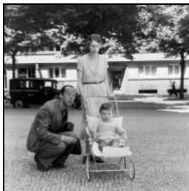
В. Набоков с женой и сыном

В статье автор разбирает четвертый роман В. Набокова "Подвиг" и рассуждает о прототипах поэтов, описанных в романе, в частности, насколько верно, что предтечей Бубнова был Бунин.